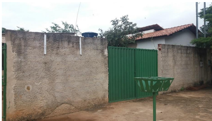
Figura 1. Registro fotográfico da visita.

No dia 08/06/2017, equipe técnica da empresa Synergia, enviou SMS para os números declarados pelo manifestante, com o objetivo que a família entre em contato com a empresa para realização do Cadastro Integrado.